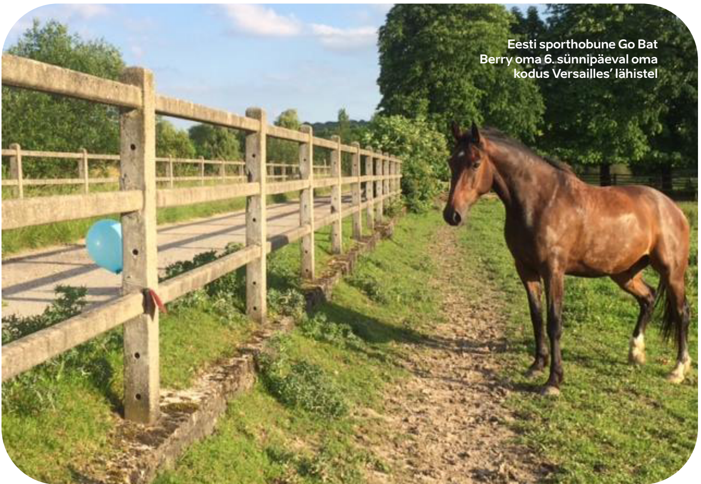
Eesti sporthobune Go Bat Berry oma 6. sünnipäeval oma kodus Versailles' lähistel