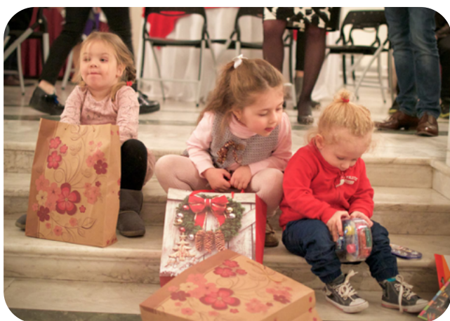
Laste jõulupidu Eesti saatkonnas Tbilisis 2017. aastal