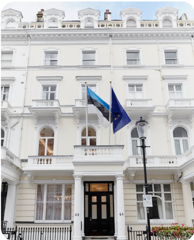
Eesti saatkond Londonis