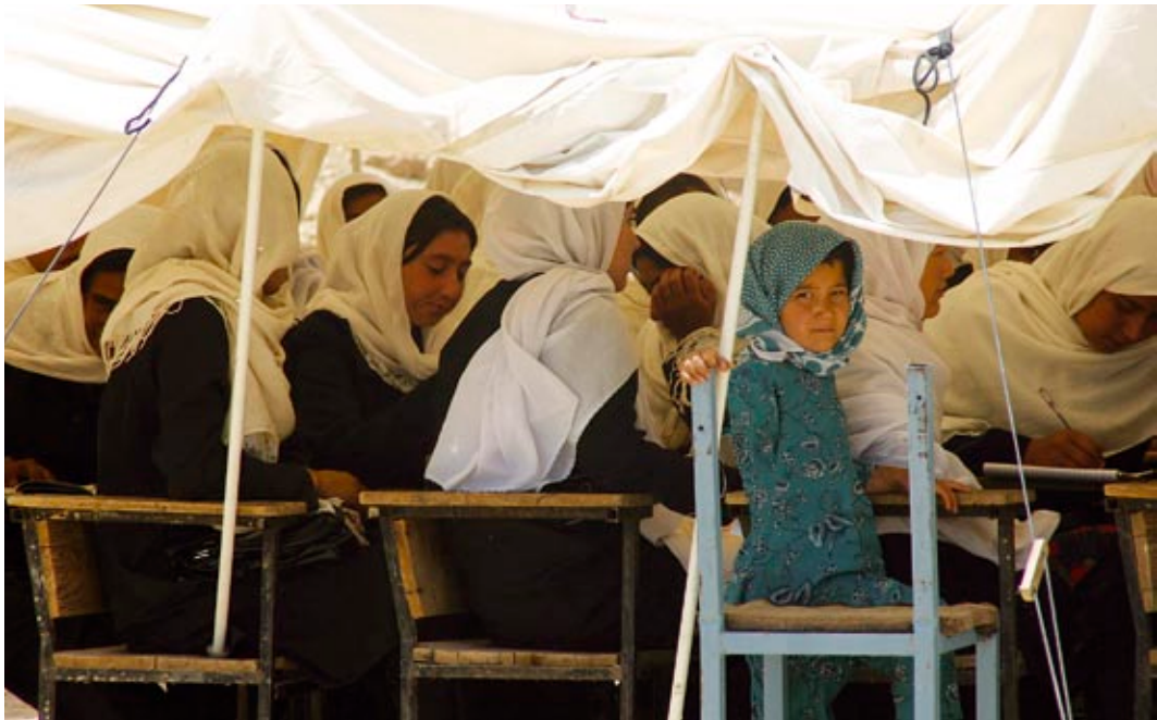
Tüdrukute kool Afganistanis.

27. Palestiina Omavalitsusele annab Eesti edasi oma info- ja kommunikatsioonitehnoloogia kasutamise kogemust hariduses. Projekti sihtrühmas on naised ja mehed võrdselt esindatud.