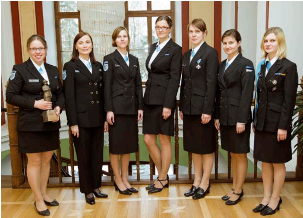
Eesti Naiskodukaitse liikmed 2011. aasta parimate tunnustamisel.

sõdurioskuste baaskursust aktsepteerib Kaitsevägi kui naissoost isikute jaoks küllaldast väljaõpet kandideerimaks sõjaväelise juhtimise I astme kõrgharidusõppesse Kaitseväe Ühendatud Õppeasutustes.