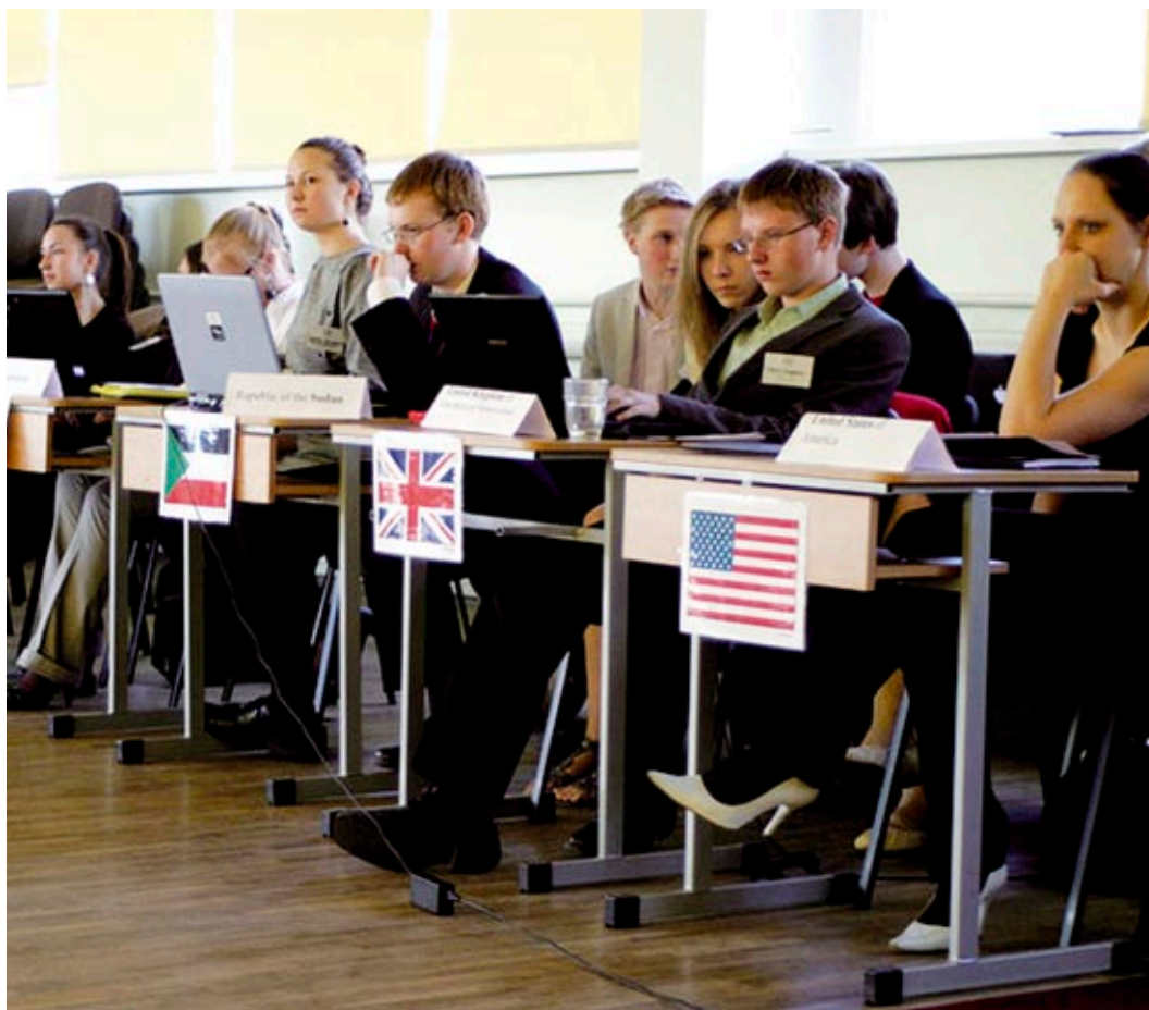
Eesti koolinoortele suunatud ÜRO simulatsioonis käsitleti aastatuhande arengueesmärkide seas ka ÜRO resolutsiooni 1325 aspekte.